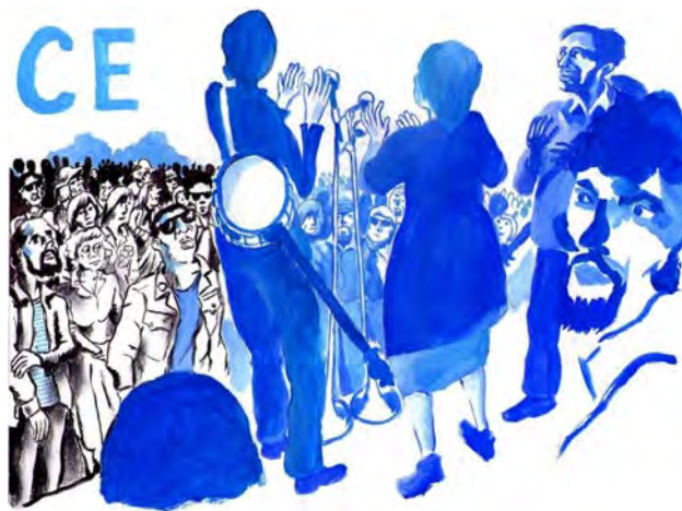
Dessin Vincent Vanoli